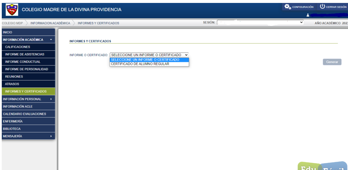
Imagen 2.1.3 "Informes y Certificados"

Para generar tu certificado de alumno regular deberás seleccionar la opción "CERTIFICADO DE ALUMNO REGULAR" y presionar el botón azul que dice "Generar"