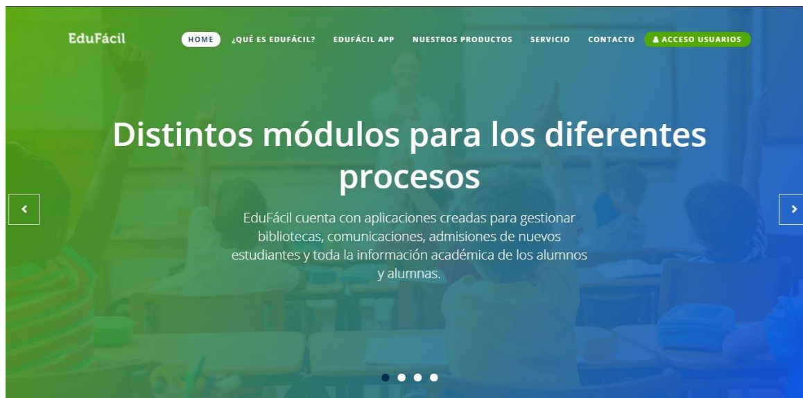
Imagen 1.1 “Página Principal EduFácil”

Para ingresar a la plataforma Edufacil debes acceder desde tu navegador web a www.edufacil.cl , una vez que cargue la página deberás hacer click en el botón verde que dice “ACCESO USUARIOS” y completar la información con tus datos de acceso (si es la primera vez que ingresas tu usuario y contraseña será el RUT del apoderado todo junto sin punto ni guión ejemplo: 15202654K).